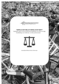
Handleiding voor professionals