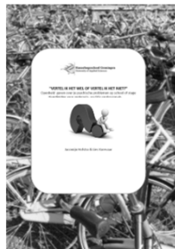
Werkboek voor studenten